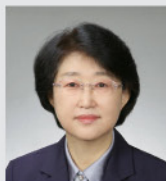
김승희 처장 식품의약품안전처