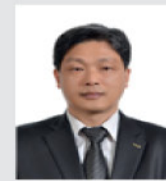
김성호 국장 식품의약품안전처